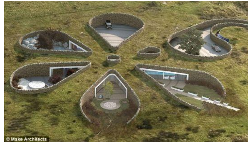
Gary Neville's teletubby house, www.makearchitects.com