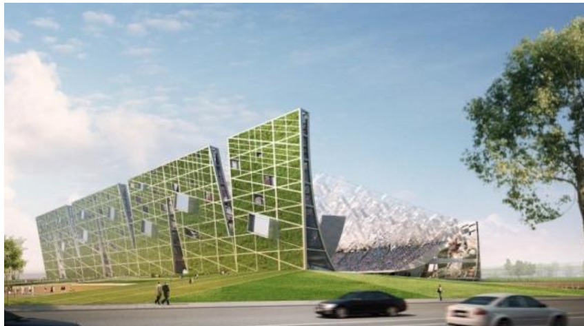
Dalian shide stadium, China, www.nbbj.com