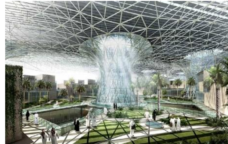
Masdar City, First Planned Net-Zero Carbon City